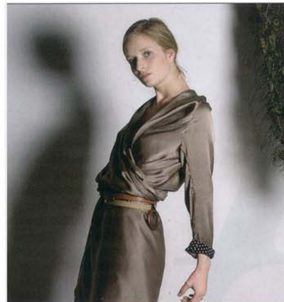
TEKST: ANNE-MARIE VAN GROEZEN, FOTOGRAFIE: MAYANNE KONST

Melanie (20) is een goed voorbeeld van die zogeheten multiproblematiek. Negen maanden geleden besloot ze om weg te gaan bij haar vriend. «Van de ene op de andere dag stond ik op straat. Ik koos er zelf voor, want het ging niet meer tussen