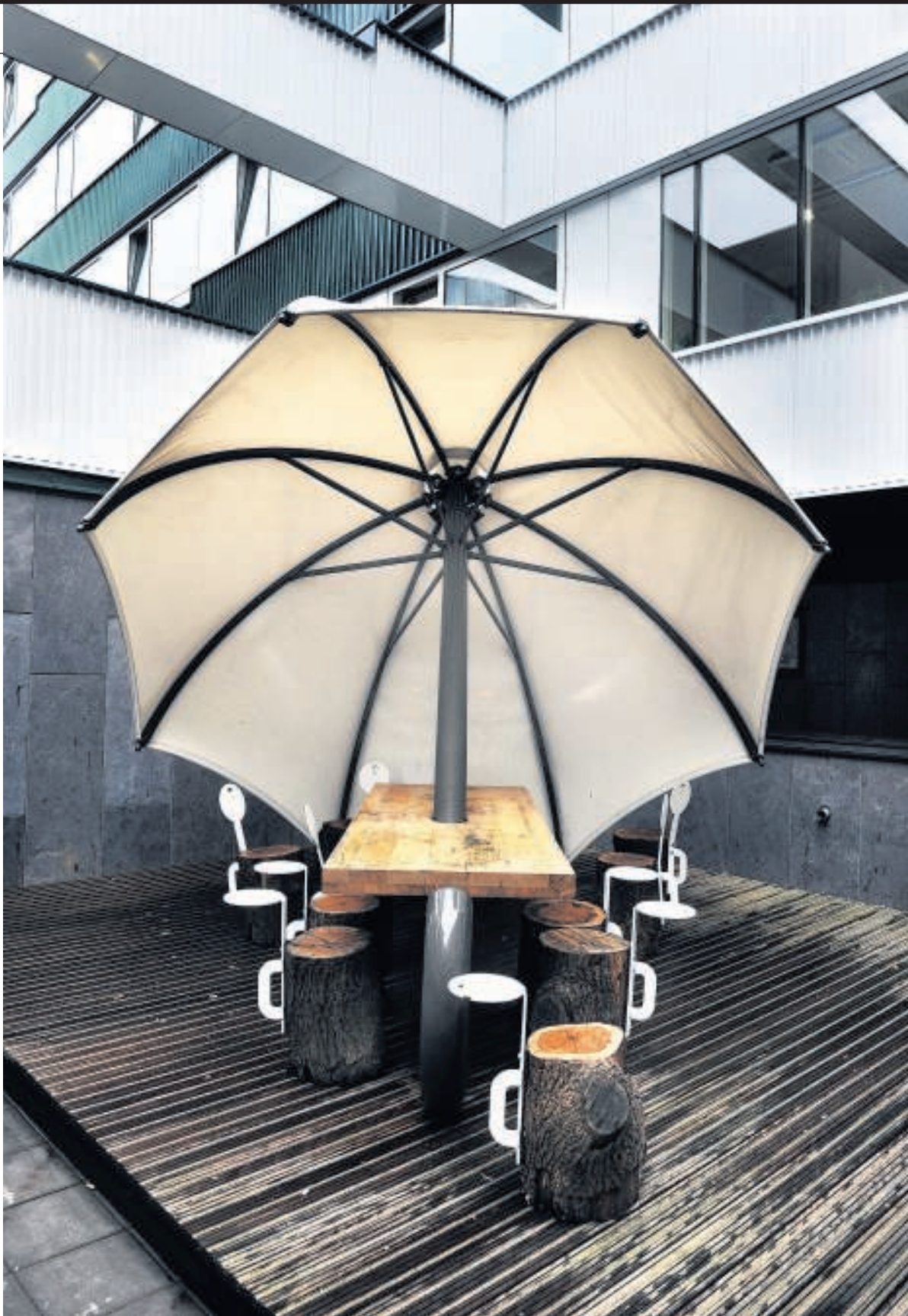
De daktuin van het opvangcomplex in Amsterdam.