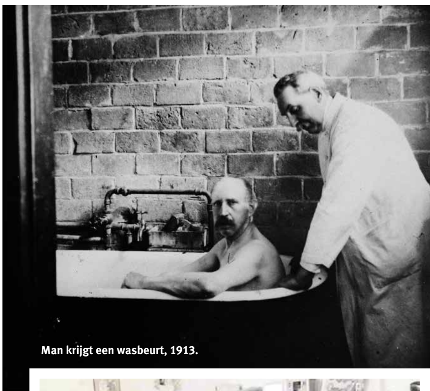
Man krijgt een wasbeurt, 1913.

Op 5 maart 1904 nam De Telegraaf een kijkje op de Bloemgracht en de Haarlemmer Houttuinen. Jonker kwam ruim aan het woord: "In onze groote stad met ruim een half miljoen inwoners waren rond 1900 een groot aantal arme mannen en vrouwen zoowel als kinderen die medelijden verdienden, en verachting ontvingen. Ze doolden als paria's langs wegen en straten zonder voedsel en voldoende kleding. Wij wilden trachten onderdak te bieden aan eenieder die daarom vroeg, werk en brood geven aan alle ellendigen die anders een gewissen ondergang te gemoet gaan... Het werk der liefde, dat wij begonnen zijn, willen wij voortzetten door te trachten hen