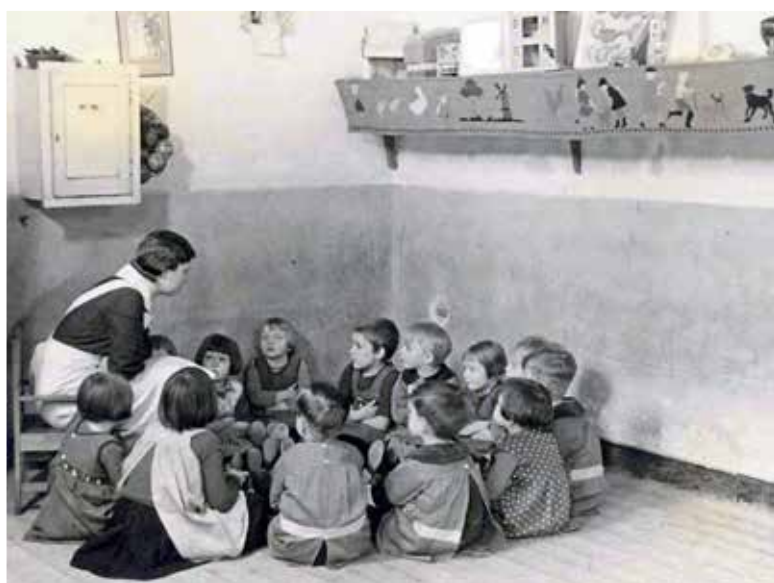
▲ De kleuterzaal van HVO in het Oude Buitengasthuis (het voormalige Pesthuis) aan de Tweede Constantijn Huygensstraat 35, jaren dertig.

nuttige leden der maatschappij te doen worden. Er moet voor hen een plek zijn waar ze terecht kunnen voor de nacht, zonder daarvoor eerst arbeid te verrichten of daarvoor te moeten betalen. Wij steken de hand toe aan oudgevangenen, aan den dronkaard, aan den zedelijk zwakke, die hulp noodig heeft en geholpen wil worden. Wij bewaren hen voor drank, bandeloosheid en gevangenis, leeren hen werken om straks in de maatschappij terug te keeren, gewapend met de kracht, die zij in onze inrichtingen ontvingen, om als eerbare mannen, dikwijls tot toonbeeld voor velen, te worden."