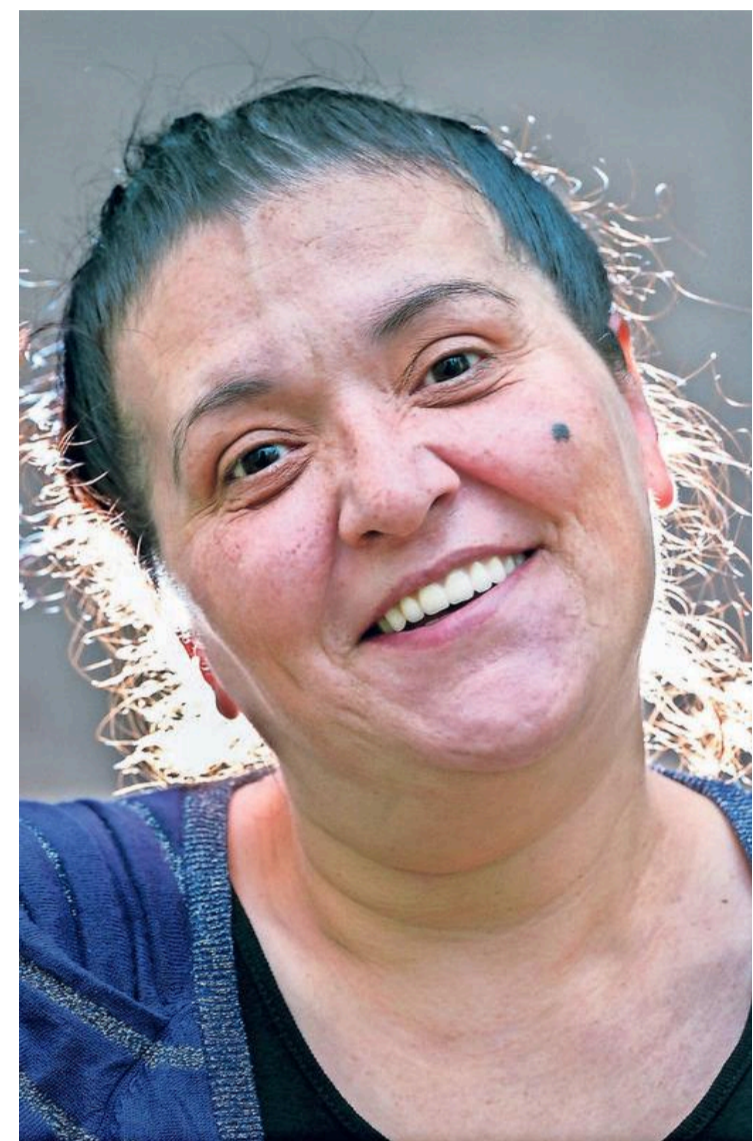
De man die Eleonora's gebit maakte was lief.