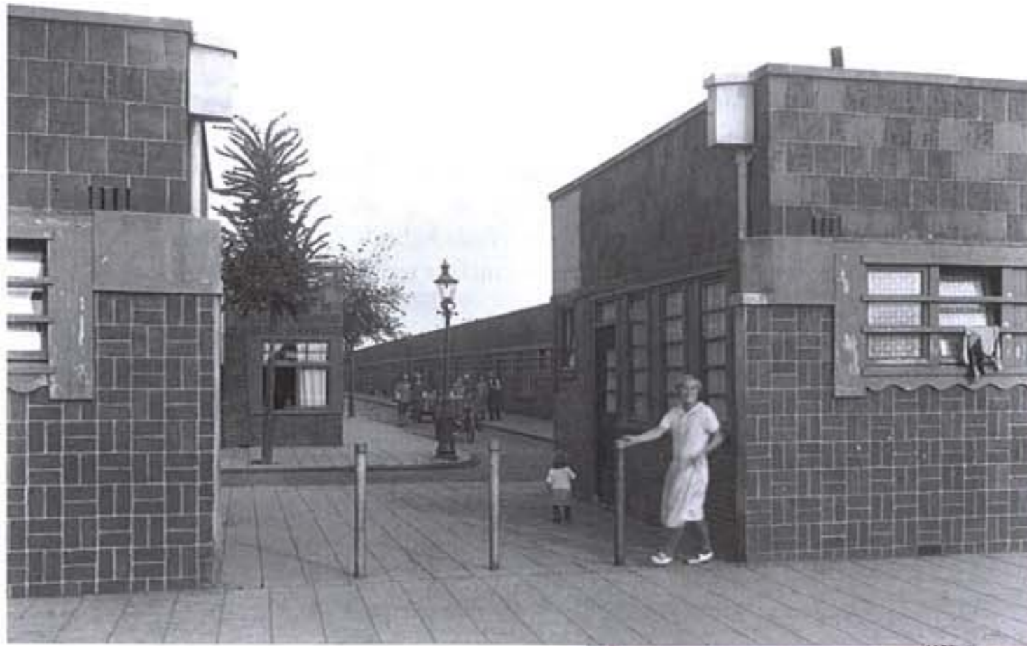
Asterdorp, 1934. De wijk herbergde tussen 1927 en 1940 circa 130 onaangepaste gezinnen. Aanvankelijk had de buurt slechts één toegangspoort.