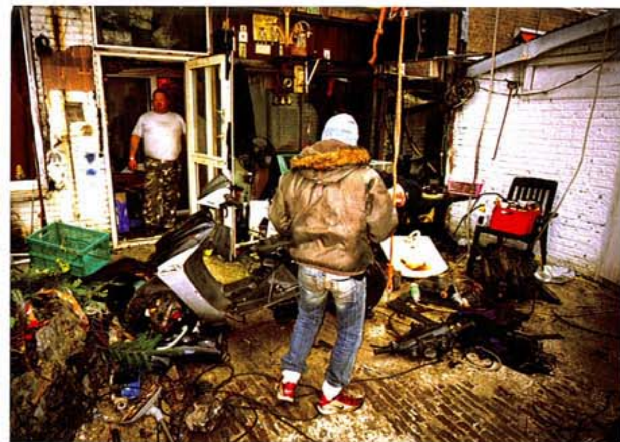
Burgemeester Van Leeuwenlaan, januari 2004. De familie Tokkie haalde in de zomer van 2003 het nieuws omdat een burenrुzie uitdraaide op een uitslaande brand. Voor de kerst moest het gezin gedwongen verhuizen, maar in januari was alles nog steeds bij het oude. De tuin deed dienst als scooter-werkplaats.