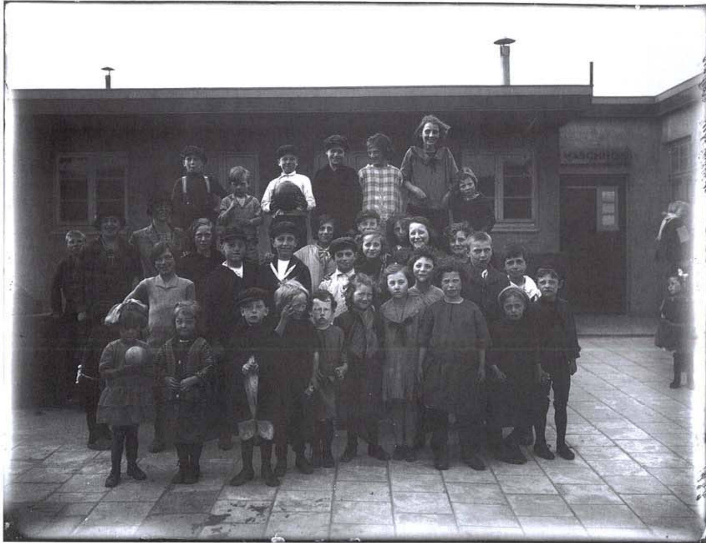
Zeeburgerdorp, kinderen poseren in 1927 voor het was-hok. Het 'tijdelijk tehuis voor gezinnen' telde 56 kleine huisjes die in 1926 werden opgeleverd en in 1944 werden afgebroken.

Amsterdam worstelt sinds jaar en dag met de opvang van onaangepaste stadsgenoten. In 1926 werd Zeeburgerdorp geopend, een jaar later gevolgd door Asterdorp. In de jaren vijftig verhuisden 'onmaatschappelijke' gezinnen naar twee aparte wijkjes in Geuzenveld en Sloterveer. En sinds vorig jaar staan aan de rand van de Houthaven vijf zogenoemde Skaeve Huse. De stad zoekt naar nieuwe antwoorden op een oud probleem.