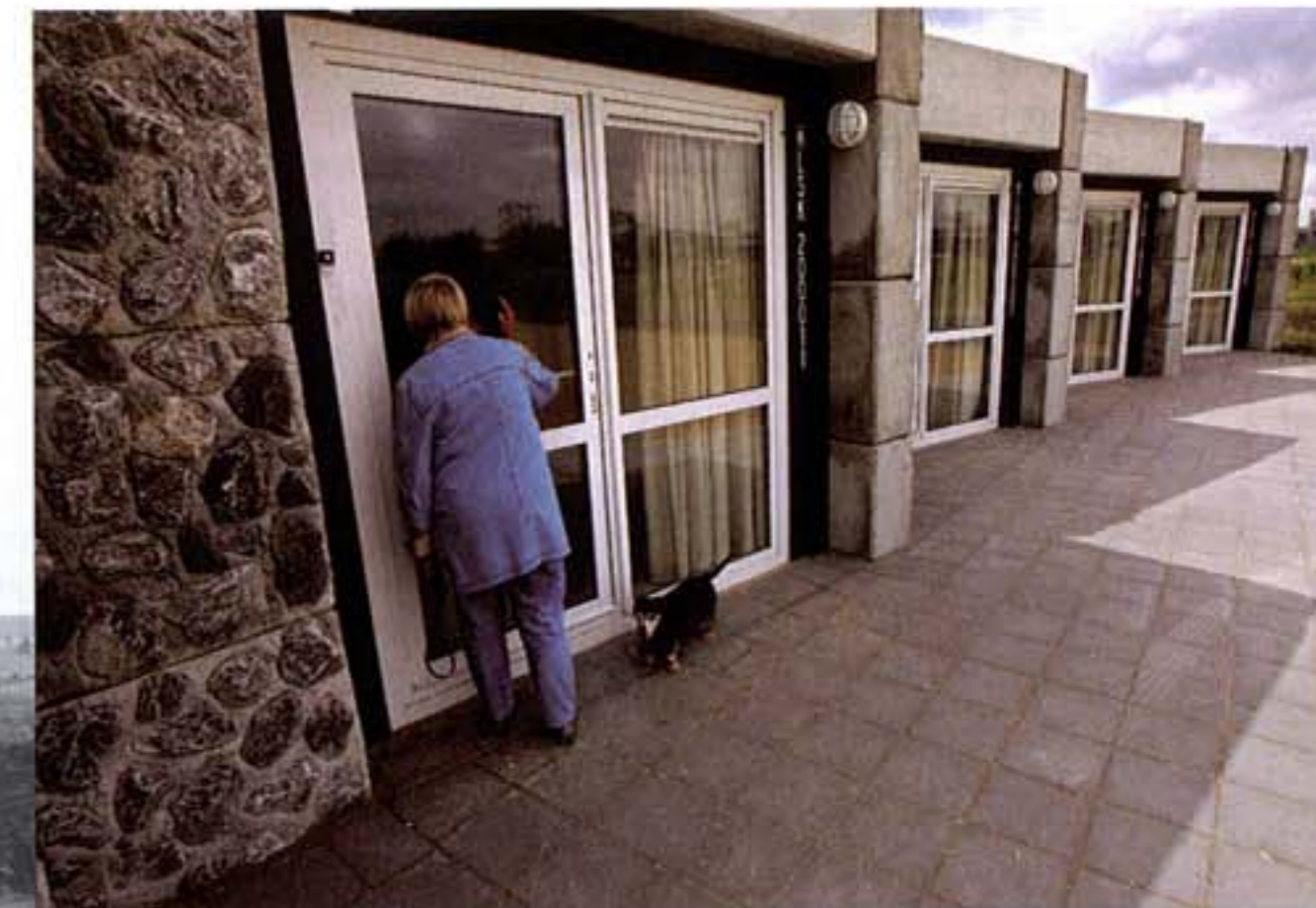
Skaeve Huse, juni 2007. Een nieuwsgierige buurtbewoonster gluurt naar binnen bij een van de vijf woningen voor onaangepaste alleenstaanden.