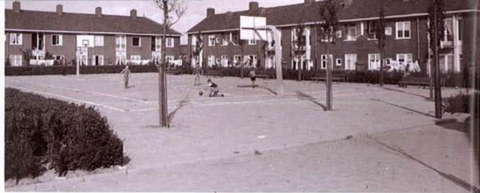
Abraham van der Hartstraat, 1959 basketbalveld in het wijkje voor 'onmaatschappelijke' gezinnen in Geuzenveld.

werden (en worden) een leven lang hardhandig met de neus gedrukt op hun minderwaardige plek van herkomst.