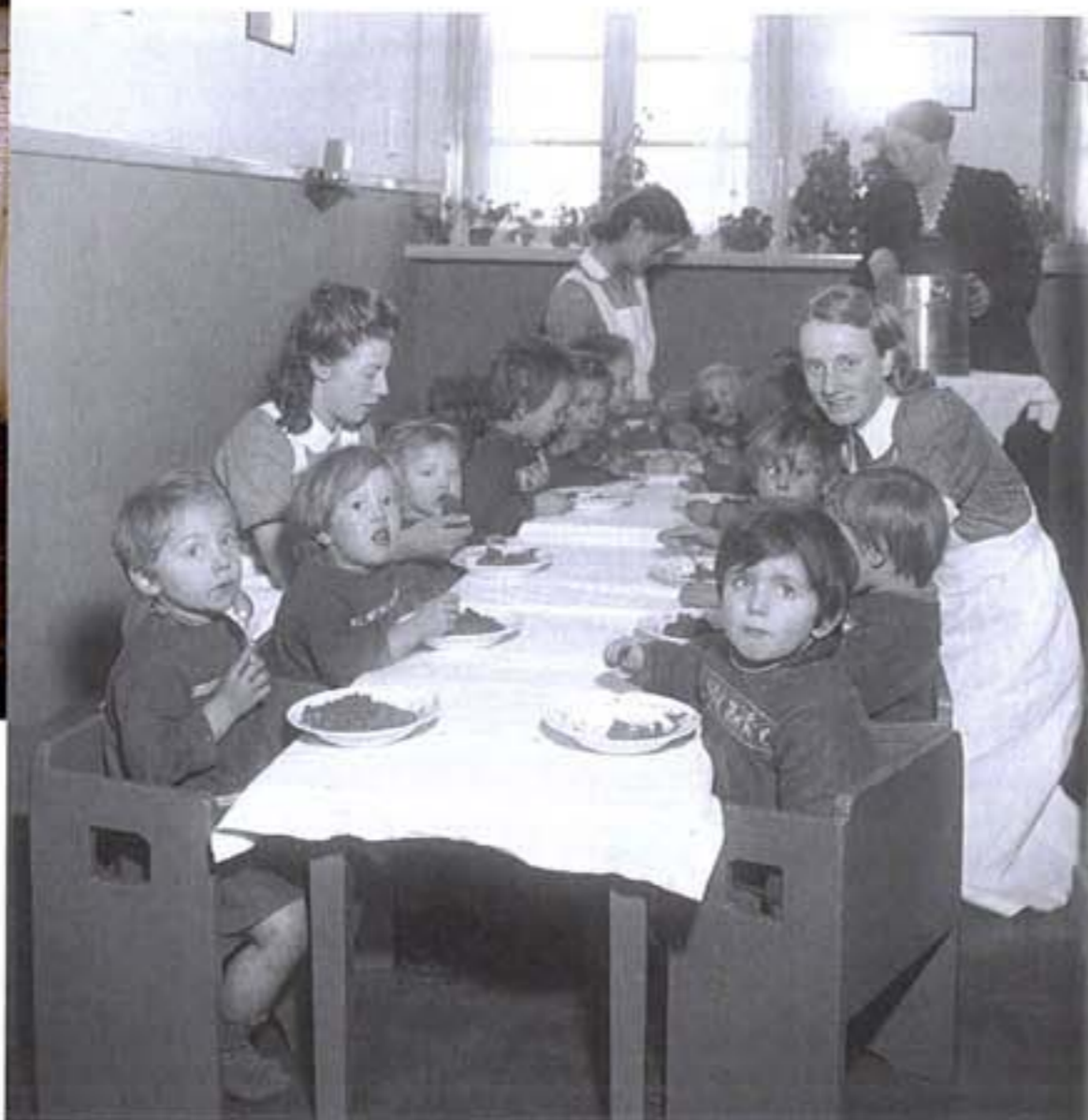
Zeeburgerdorp, 1941, kinderen zitten samen met hun verzorgers aan het middagmaal.